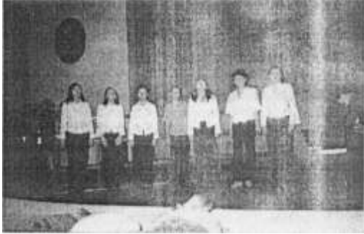
Вокальный ансамбль исполняет песню «Ты соловушка, умолкни»